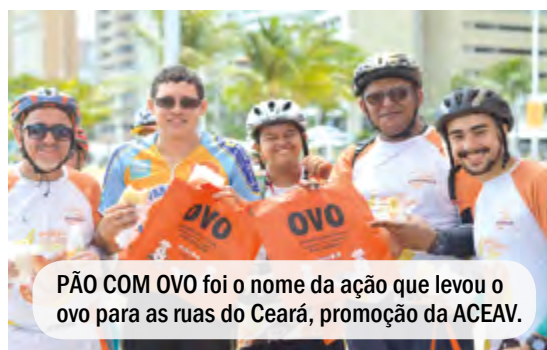
PÃO COM OVO foi o nome da ação que levou o ovo para as ruas do Ceará, promoção da ACEAV.

A diretoria da entidade agradece a todos que colaboraram direta e indiretamente para a realização da Semana do Ovo 2019. "Aos associados, às associações, aos veículos de comunicação que durante todo esse período informaram e divulgaram as ações, enfim, a todos que participaram", conclui.