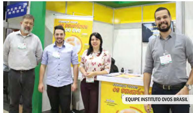
EQUIPE INSTITUTO OVOS BRASIL