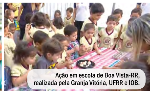
Ação em escola de Boa Vista-RR, realizada pela Granja Vitória, UFRR e IOB.