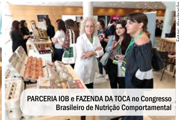
PARCERIA IOB e FAZENDA DA TOCA no Congresso Brasileiro de Nutrição Comportamental