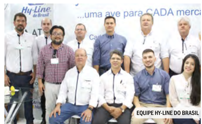
EQUIPE HY-LINE DO BRASIL