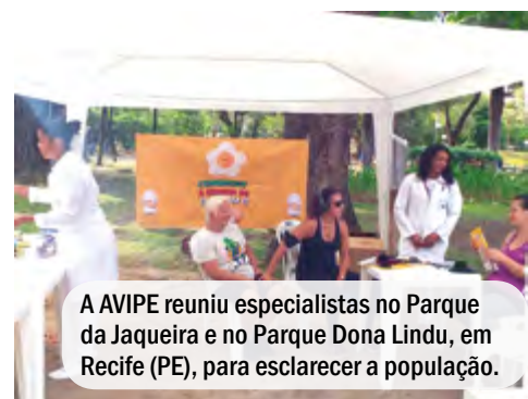
A AVIPE reuniu especialistas no Parque da Jaqueira e no Parque Dona Lindu, em Recife (PE), para esclarecer a população.