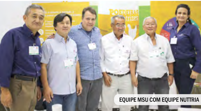
EQUIPE MSU COM EQUIPE NUTRIA