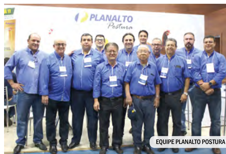
EQUIPE PLANALTO POSTURA