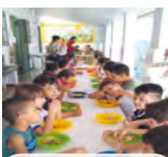
DEGUSTAÇÃO DE OVOS na creche CMEI Bem Me Quer em Goiânia (GO), ação da AGA