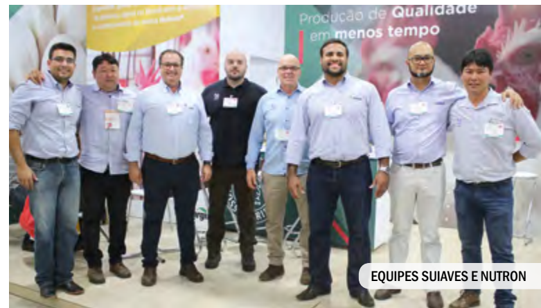
EQUIPES SUIAVES E NUTRON