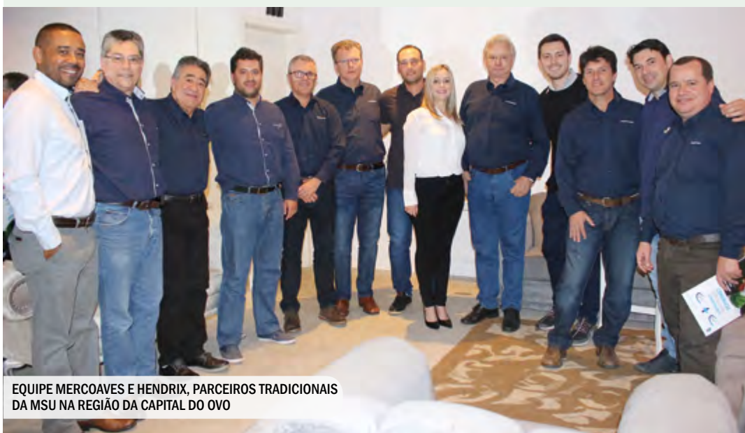
EQUIPE MERCOAVES E HENDRIX, PARCEIROS TRADICIONAIS DA MSU NA REGIÃO DA CAPITAL DO OVO