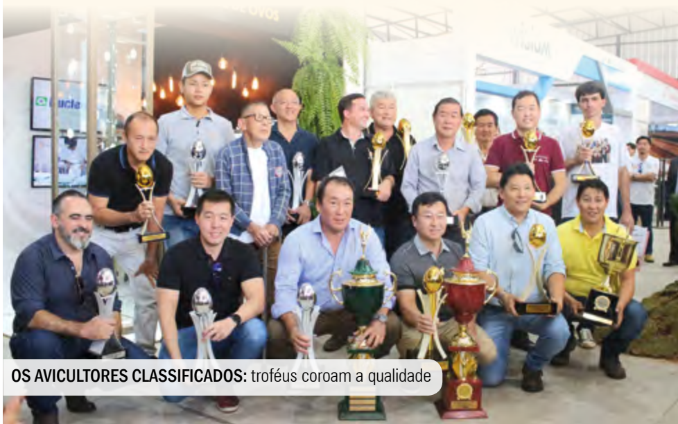
OS AVICULTORES CLASSIFICADOS: troféus coroam a qualidade