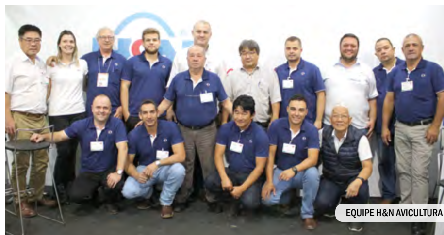
EQUIPE H&amp;N AVICULTURA