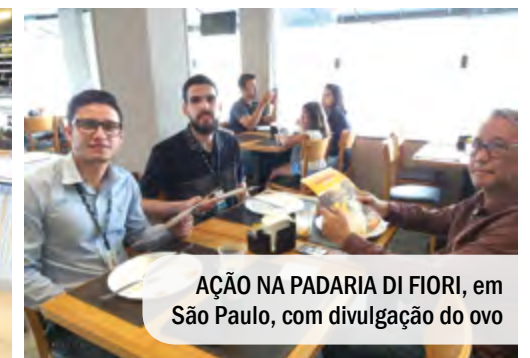
AÇÃO NA PADARIA DI FIORI, em São Paulo, com divulgação do ovo