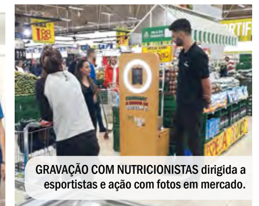
GRAVAÇÃO COM NUTRICIONISTAS dirigida a esportistas e ação com fotos em mercado.