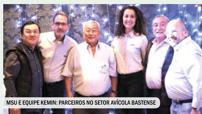
MSU E EQUIPE KEMIN: PARCEIROS NO SETOR AVÍCOLA BASTENSE