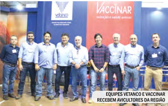
EQUIPES VETANCO E VACCINAR RECEBEM AVICULTORES DA REGIÃO