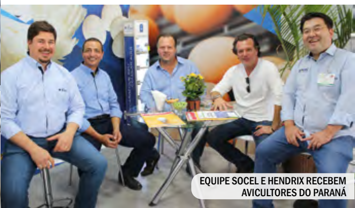
EQUIPE SOCEL E HENDRIX RECEBEM AVICULTORES DO PARANÁ