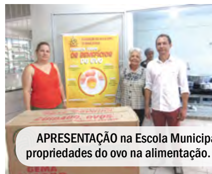
APRESENTAÇÃO na Escola Municipal Construtor, em Minas Gerais sobre as propriedades do ovo na alimentação. Uma realização AVIMIG com apoio do IOB.