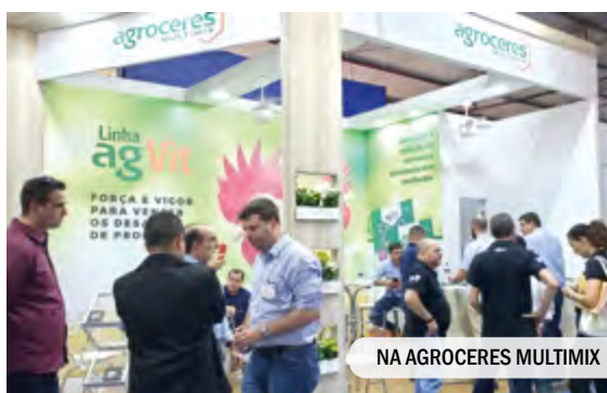
NA AGROCERES MULTIMIX