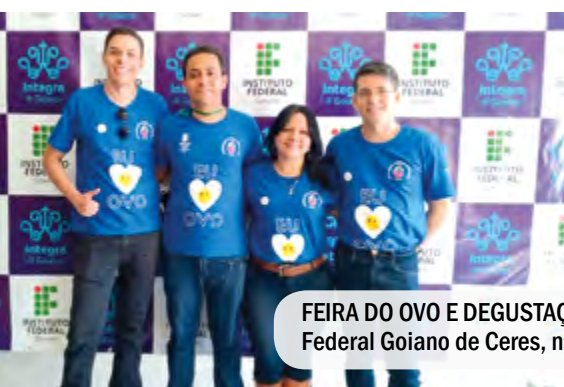
FEIRA DO OVO E DEGUSTAÇÃO DE OMELETES no Instituto Federal Goiano de Ceres, num ação da AGA e apoio do IOB.