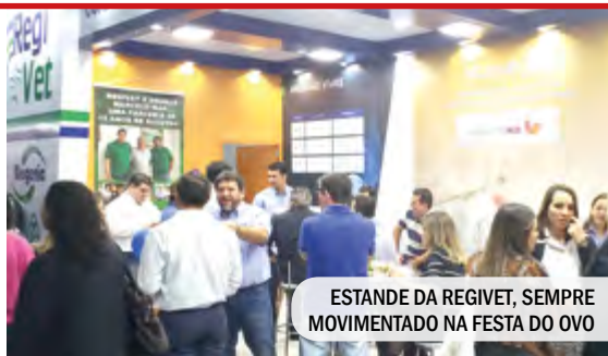
ESTANDE DA REGIVET, SEMPRE MOVIMENTADO NA FESTA DO OVO