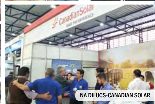
NA DILUCS-CANADIAN SOLAR