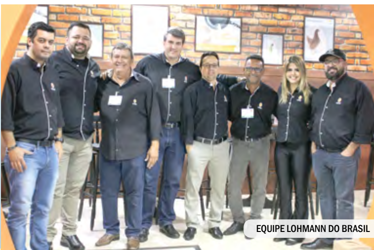
EQUIPE LOHMANN DO BRASIL