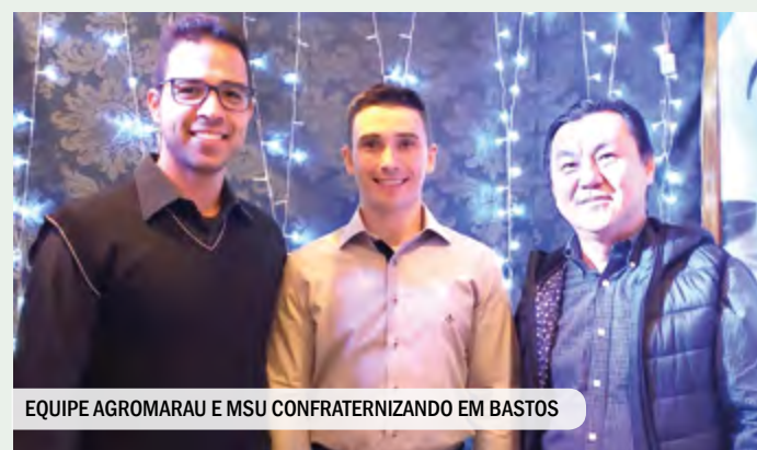
EQUIPE AGROMARAU E MSU CONFRATERNIZANDO EM BASTOS