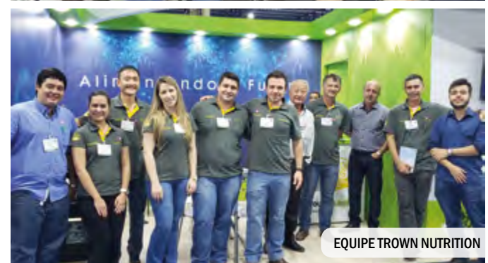
EQUIPE TROWN NUTRITION