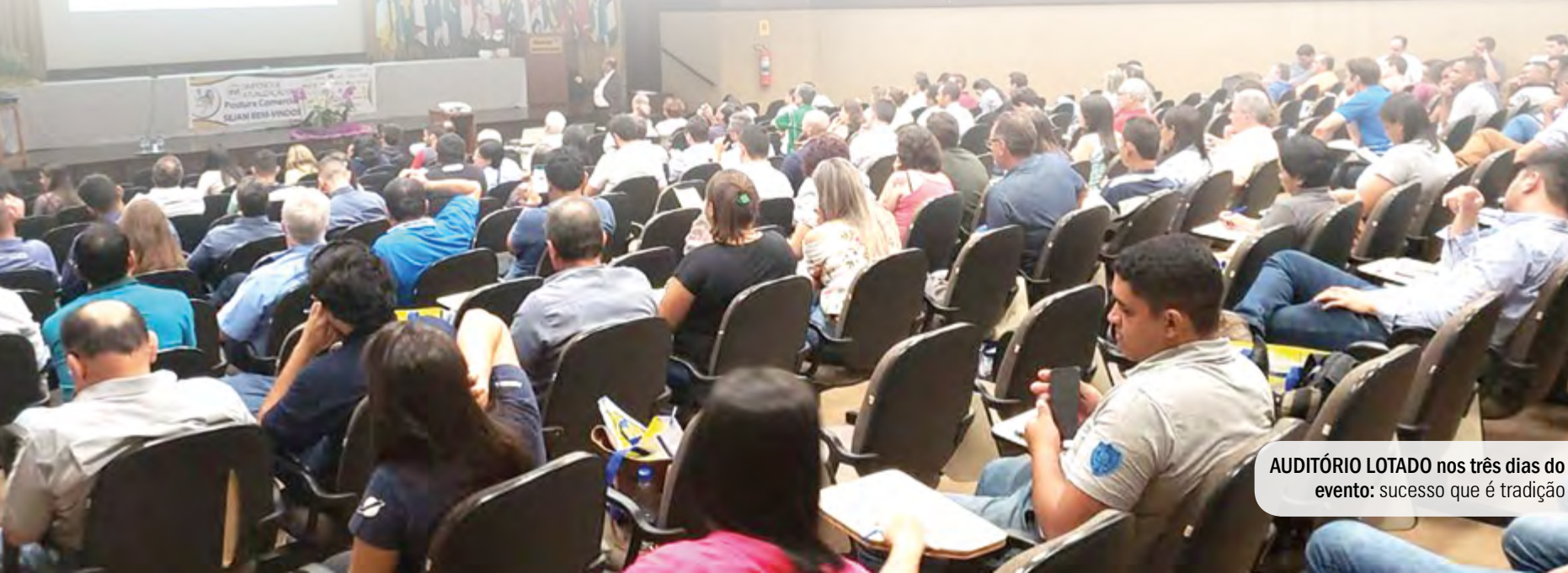
AUDITÓRIO LOTADO nos três dias do evento: sucesso que é tradição