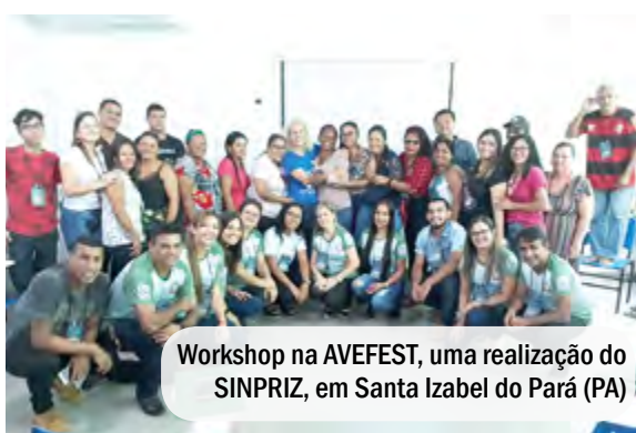
Workshop na AVEFEST, uma realização do SINPRIZ, em Santa Izabel do Pará (PA)