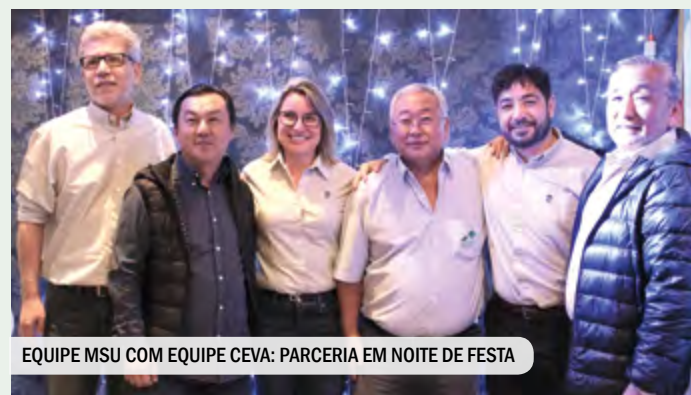
EQUIPE MSU COM EQUIPE CEVA: PARCERIA EM NOITE DE FESTA