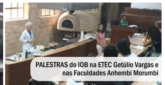
PALESTRAS do IOB na ETEC Getúlio Vargas e nas Faculdades Anhembí Morumbi