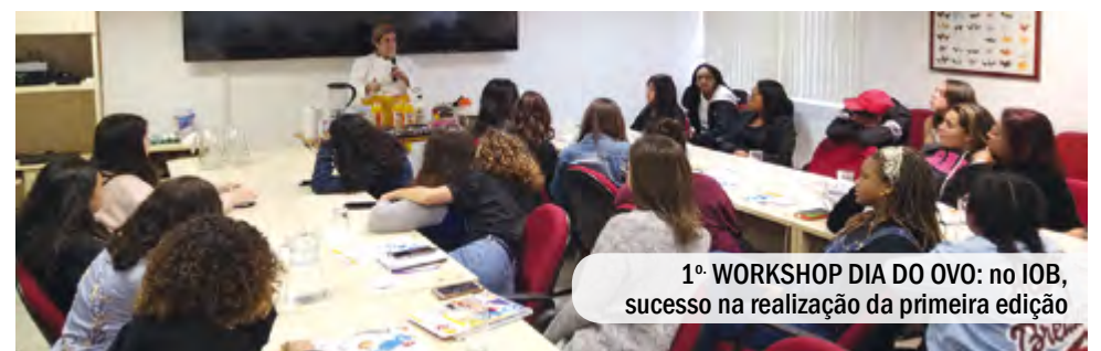
1º WORKSHOP DIA DO OVO: no IOB, sucesso na realização da primeira edição