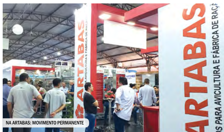
NA ARTABAS: MOVIMENTO PERMANENTE