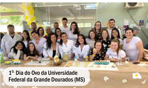
1º Dia do Ovo da Universidade Federal da Grande Dourados (MS)