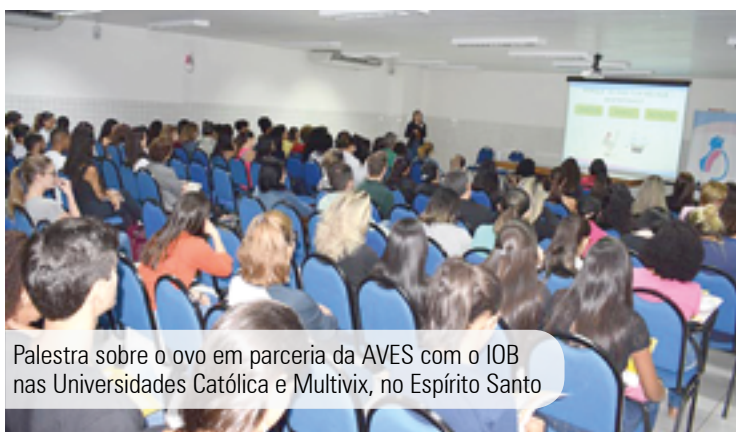
Palestra sobre o ovo em parceria da AVES com o IOB nas Universidades Católica e Multivix, no Espírito Santo