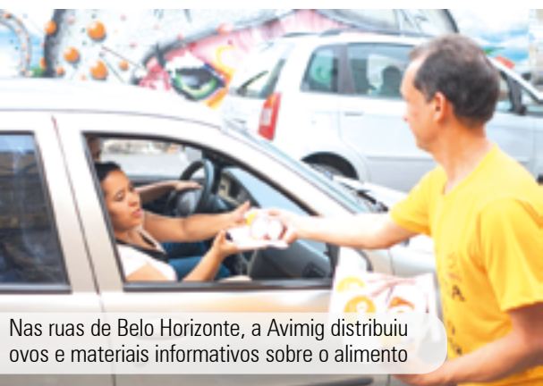
Nas ruas de Belo Horizonte, a Avimig distribuiu ovos e materiais informativos sobre o alimento