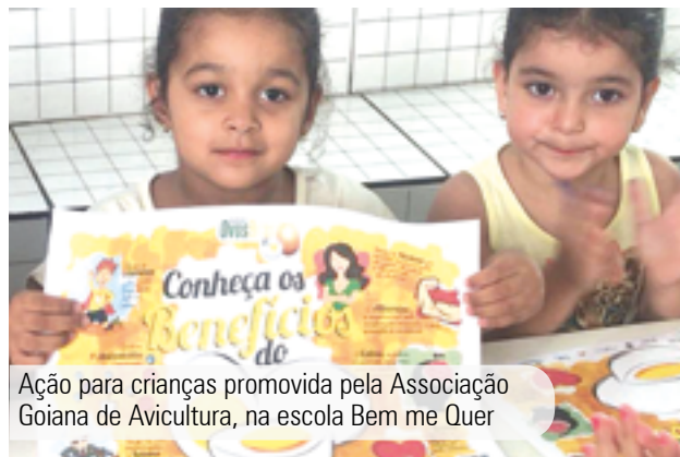
Ação para crianças promovida pela Associação Goiana de Avicultura, na escola Bem me Quer