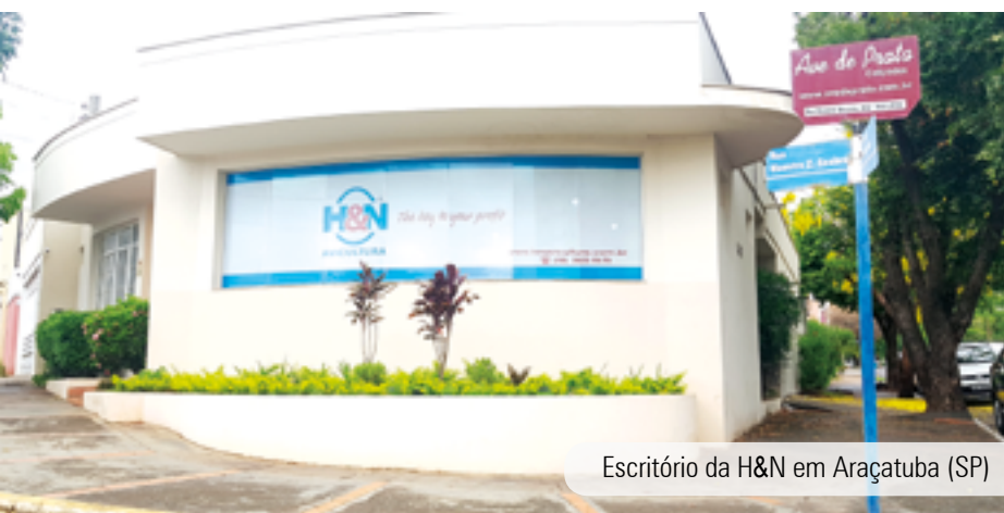
Escritório da H&N em Araçatuba (SP)