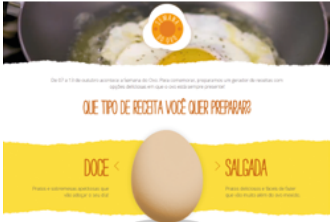
CAMPANHA DA AVIPE (PE). A entidade lançou com a Globo um hotsite de receitas para interagir com a comunidade. Excelente ideia: semanadoovo.globo.com