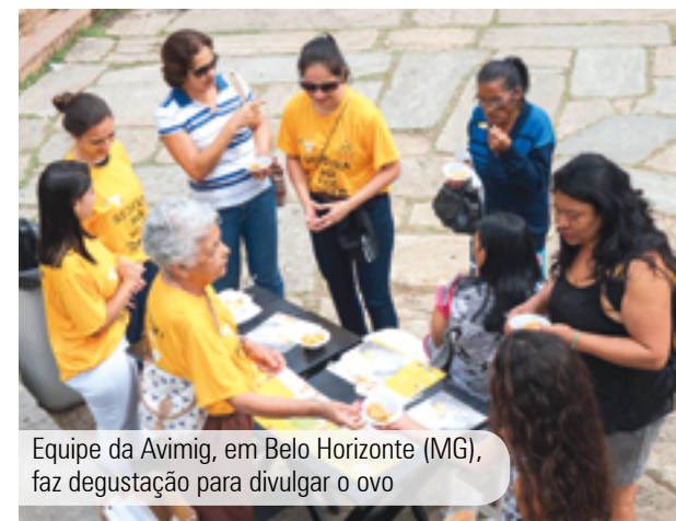
Equipe da Avimig, em Belo Horizonte (MG), faz degustação para divulgar o ovo