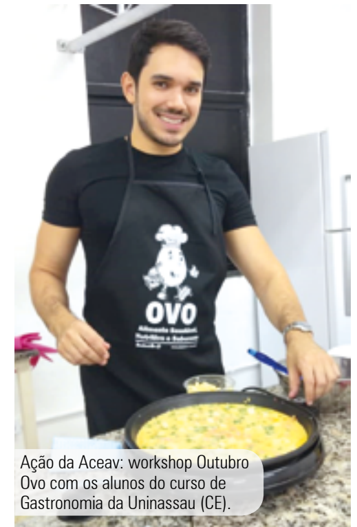
Ação da Aceav: workshop Outubro Ovo com os alunos do curso de Gastronomia da Uninassau (CE).