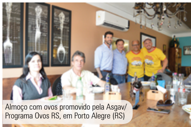
Almoço com ovos promovido pela Asgav/ Programa Ovos RS, em Porto Alegre (RS)