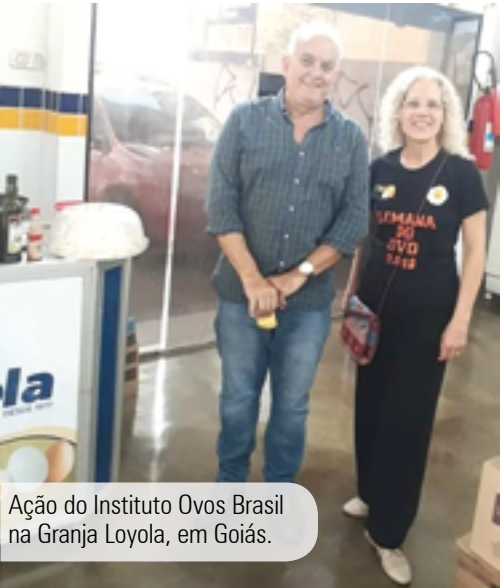
Ação do Instituto Ovos Brasil na Granja Loyola, em Goiás.

Palestras, degustações, encontros, refeições em conjunto e muita informação. Assim foi a Semana do Ovo 2018 nas empresas, universidades e granjas pelo país. Um sucesso!