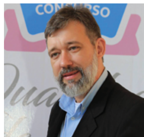
NELIO HAND: setor organizado

BASTOS. A diretoria do Sindicato Rural de Bastos, que integra produtores de ovos de toda a microrregião do município paulista - responsável desde os anos 1960 pela maior produção de ovos do