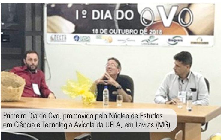
Primeiro Dia do Ovo, promovido pelo Núcleo de Estudos em Ciência e Tecnologia Avícola da UFLA, em Lavras (MG)