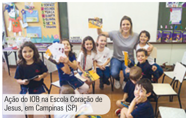
Ação do IOB na Escola Coração de Jesus, em Campinas (SP)