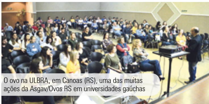
O ovo na ULBRA, em Canoas (RS), uma das muitas ações da Asgav/Ovos RS em universidades gaúchas