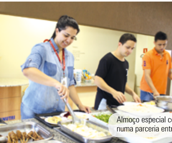
Almoço especial com ovos na Ceva, numa parceria entre a empresa e o IOB