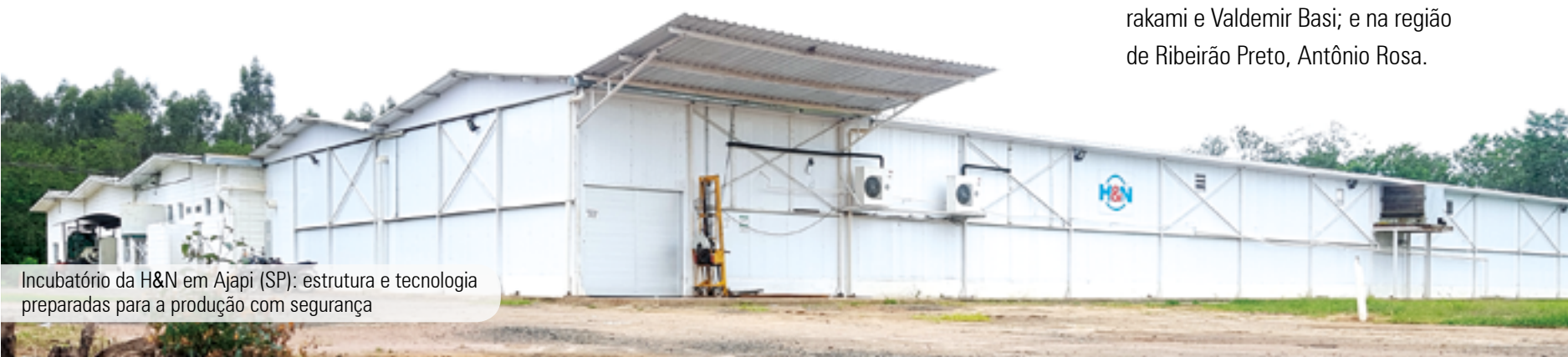
Incubatório da H&N em Ajapi (SP): estrutura e tecnologia preparadas para a produção com segurança