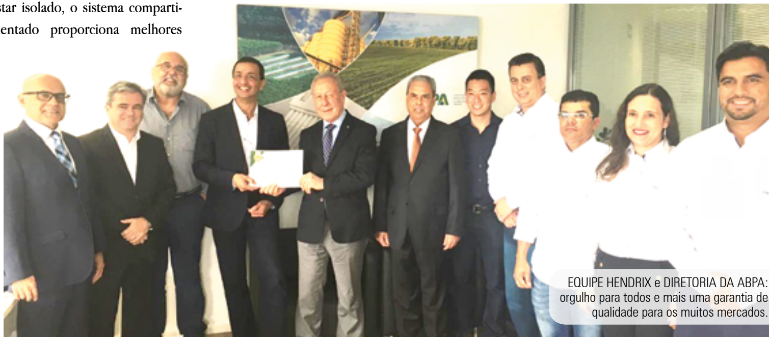
EQUIPE HENDRIX e DIRETORIA DA ABPA: orgulho para todos e mais uma garantia de qualidade para os muitos mercados.

O executivo ainda ressalta que a compartimentação foi uma iniciativa fantástica no âmbito do PNSA, o Programa Nacional de Sanidade Avícola. “Trata-se de um tema que supera questões de concorrência e disputas de mercado; trata-se de algo maior em direção a manter a sanidade do rebanho avícola brasileiro”. O país é pioneiro na implantação desse sistema de proteção sanitária.