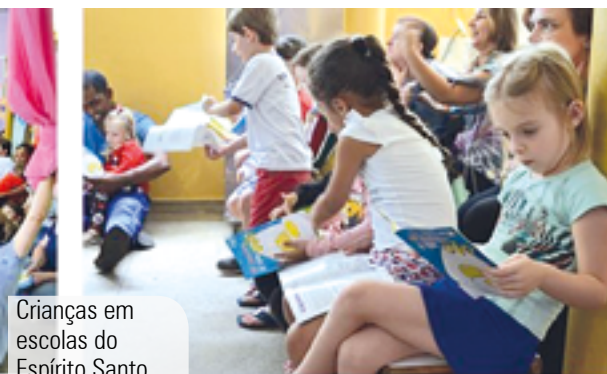
Crianças em escolas do Espírito Santo, participando de ações da AVES