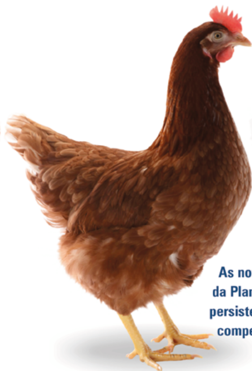
LOHMANN BROWN-LITE NA