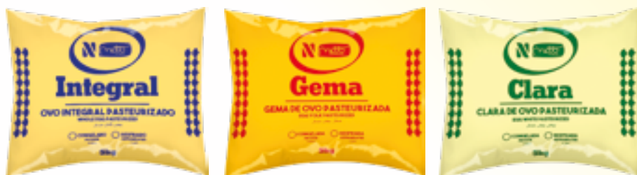
Bags com ovoprodutos congelados: produtos da Netto Alimentos com alta aceitação no SIAL 2018, em Paris

Saiba mais sobre a Netto Alimentos: www.nettoalimentos.com.br .