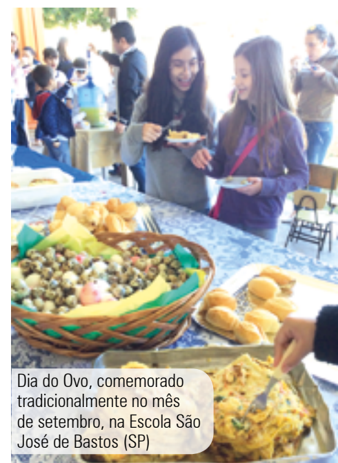
Dia do Ovo, comemorado tradicionalmente no mês de setembro, na Escola São José de Bastos (SP)

VÍDEO PRODUZIDO PELA ASSOCIAÇÃO GAÚCHA DE AVICULTURA na Semana do Ovo 2018, homenageando 12 profissões da comunidade