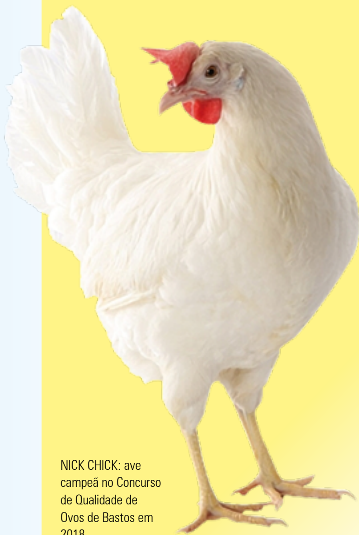
NICK CHICK: ave campeã no Concurso de Qualidade de Ovos de Bastos em 2018