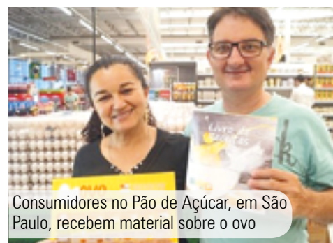
Consumidores no Pão de Açúcar, em São Paulo, recebem material sobre o ovo