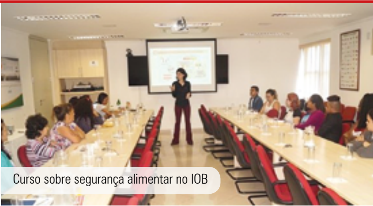
Curso sobre segurança alimentar no IOB