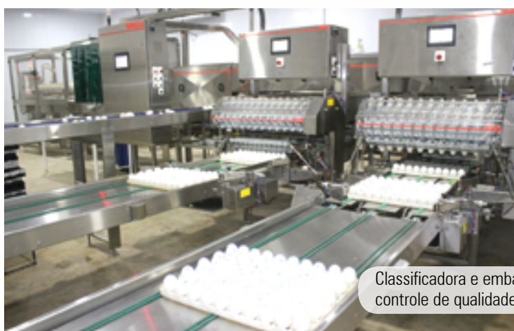
Classificadora e embandejadora de ovos férteis: controle de qualidade dos ovos a serem incubados