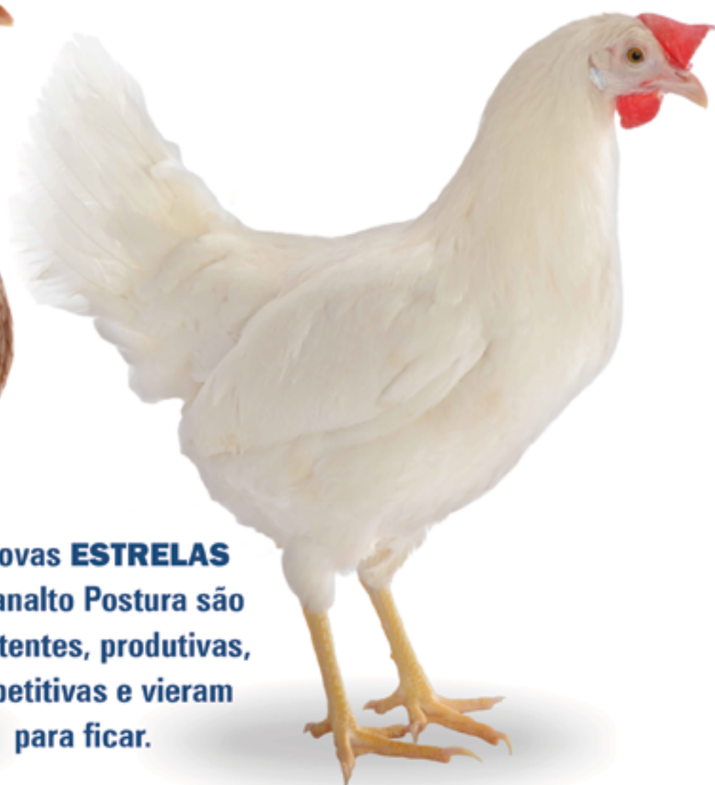
LOHMANN LSL-LITE NA

As novas ESTRELAS da Planalto Postura são persistentes, produtivas, competitivas e vieram para ficar.