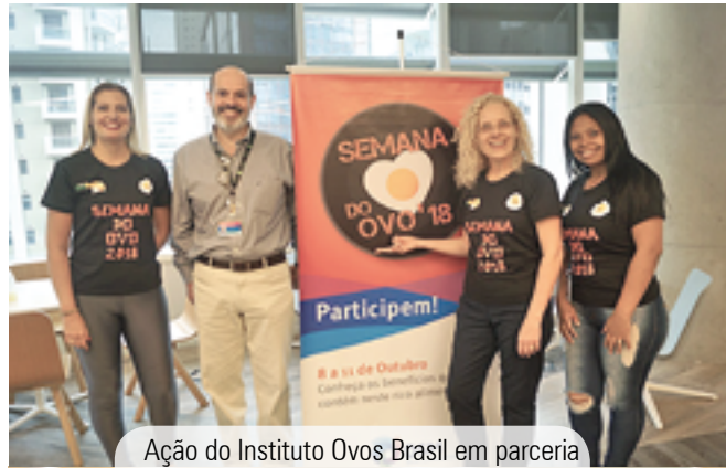
Ação do Instituto Ovos Brasil em parceria com a DSM, na unidade da empresa (SP)