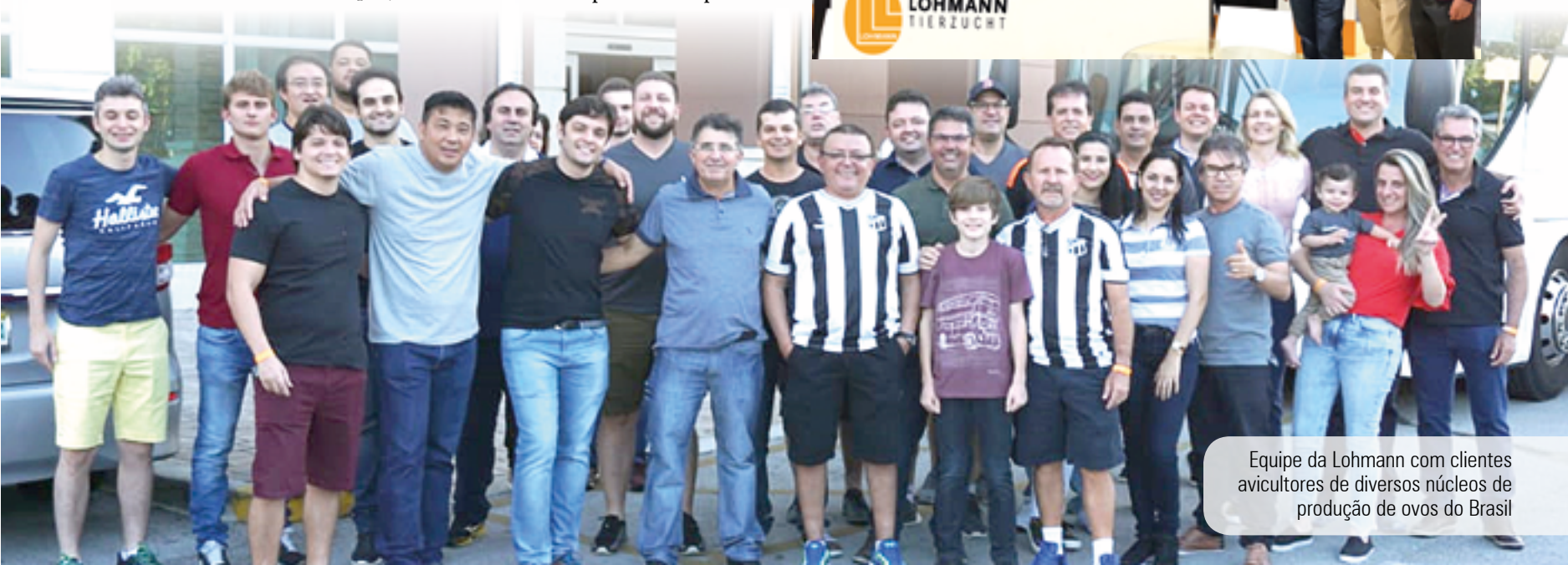
Equipe da Lohmann com clientes avicultores de diversos núcleos de produção de ovos do Brasil