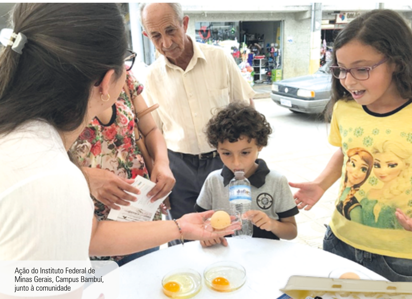
Ação do Instituto Federal de Minas Gerais, Campus Bambuí, junto à comunidade